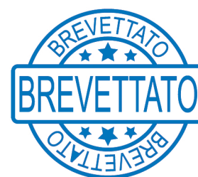
Sagoma taglio Fustellatore